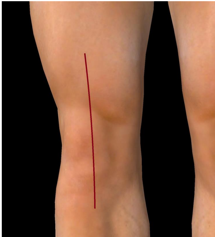
litteken aan de voorzijde van de knie